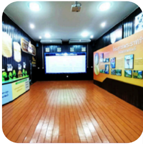
ห้องวัฒนธรรมนำพัฒนา