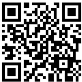
สแกนเพื่อ แสดงความเคลื่อนไหวความหมายของห้อง