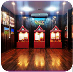
ห้องวัฒนธรรม